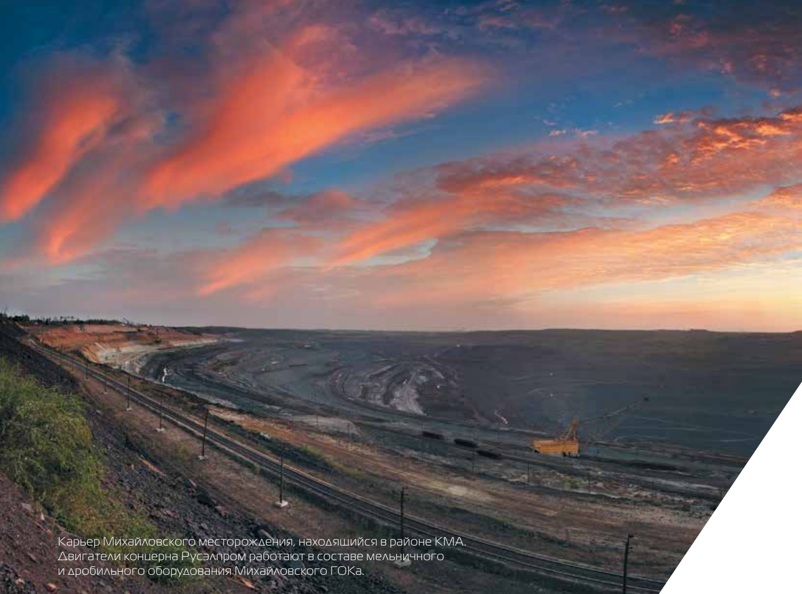
Карьер Михайловского месторождения, находящийся в районе КМА. Двигатели концерна Русэлпром работают в составе мельничного и дробильного оборудования Михайловского ГОКа.